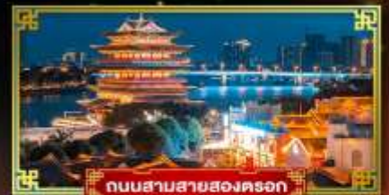
ถนนสามสายสองตรอก