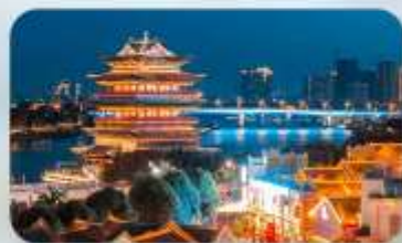
ถนนสามสายสองตรอก