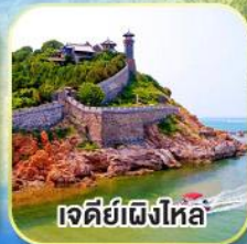
เจดีย์เฝิงไหล