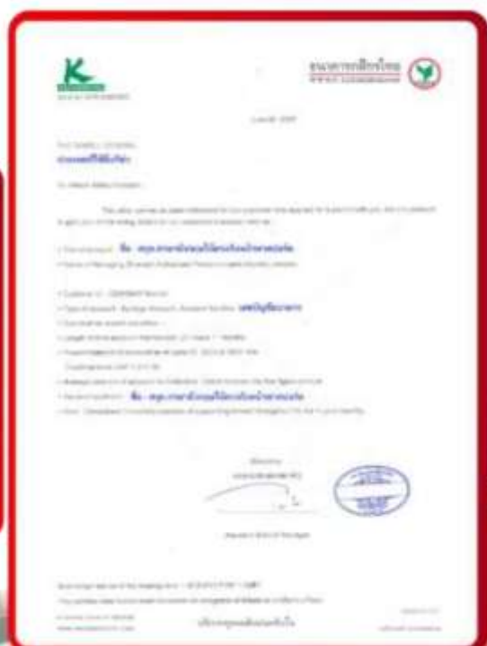
ตัวอย่าง Bank Guarantee ที่ยื่นได้ตรงกับกัมพูชา