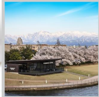
“TOYAMA KANSUI PARK”