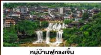
หมู่บ้านฟุทงเจิน