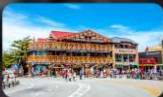
ฟูจิชั้น 5

INTERNATIONAL RESORT HOTEL YURAKUJO MARITA หรือเทียบเท่ามาตรฐานญี่ปุ่น