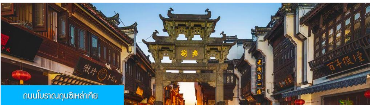
ถนนโบราณถุนซีเหล่าเจีย

หลังอาหารนำท่านเที่ยวชม หมู่บ้านโบราณหงซุน 宏村 หมู่บ้านโบราณจีนชื่ออายุกว่า 800 ปีที่ได้รับการขึ้น ทะเบียนเป็นมรดกโลกทางวัฒนธรรมจาก UNESCO ชมบ้านเรือนโบราณที่ถูกสร้างขึ้นในยุคราชวงศ์หมิง และ ราชวงศ์ชิงที่ยังคงสภาพที่สมบูรณ์กว่า 140 หลัง นำท่านเที่ยวชมตามจุดเช็คอินขึ้นชื่อภายในหมู่บ้าน อาทิ บึงน้ำ พระจันทร์ ทะเลสาบหนานหู โรงเรียนหนานหู หอบรรพบุรุษ คลองน้ำหงซุน ต้นไม้โบราณ ฯลฯ จากนั้นนำท่านเดินทางสู่เมือง หวงซาน (ระยะทาง 70 กม. ใช้เวลาเดินทางราว 1 ชั่วโมง)