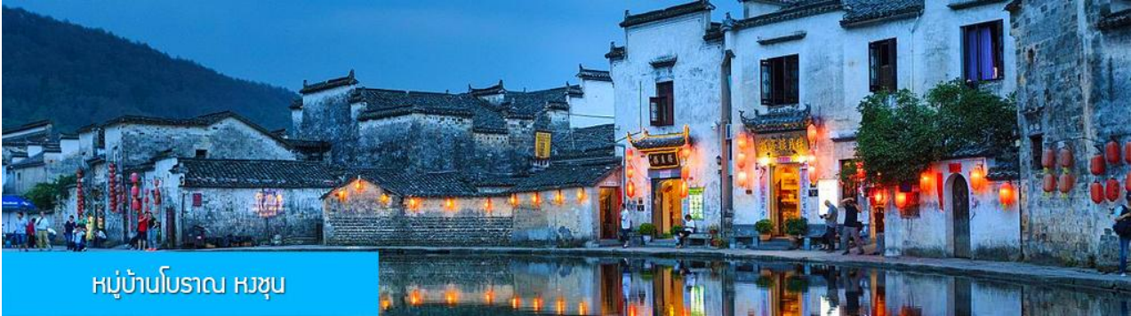
หมู่บ้านโบราณ หงซุน

พักที่ โรงแรม JIANGNAN HAOTING HOTEL ระดับ 4 ดาวท้องถิ่นหรือเทียบเท่าในเมืองซ่งเหรา