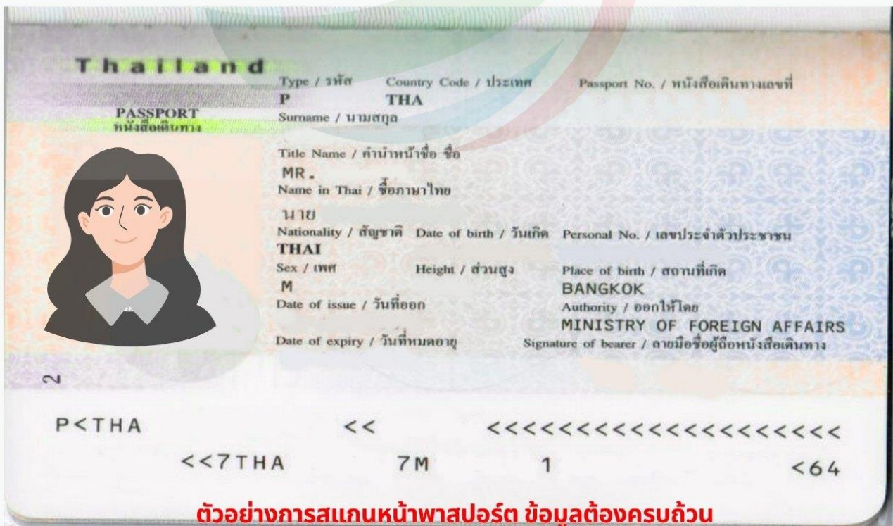
ตัวอย่างการสแกนหน้าพาสปอร์ต ข้อมูลต้องครบถ้วน ท่านสามารถสแกนส่งไฟล์ PDF หรือถ่ายรูปส่งแทนได้ ( รูปไม่เอียง ไม่ติดนิ้ว )

การพิจารณาวีซ่าเป็นดุลยพินิจของทางสถานทูตเท่านั้น ทางบริษัทเป็นผู้ดำเนินการเรื่องเอกสารและอำนวยความสะดวก ซึ่งสามารถกรอกออนไลน์ได้ก่อนเดินทาง 30 วัน หรือหลังจากท่านชำระเงินงวดสุดท้าย ทั้งนี้หลังจากกรอกข้อมูลเข้าระบบแล้วใช้เวลาพิจารณา 7-15 วันทำการ กรณีวีซ่าท่านล่าช้าหรือถูกปฏิเสธและมีค่าใช้จ่ายเพิ่มเติม ทางบริษัทขอสงวนสิทธิ์เก็บตามค่าใช้จ่ายที่เกิดขึ้นจริง