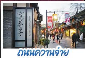
ถนนควานจ้าย