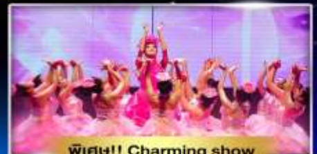
พิเศษ!! Charming show