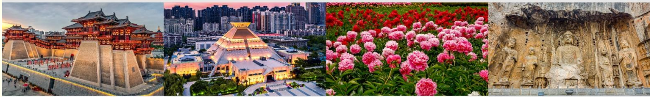
พิพิธภัณฑ์มณฑลเหอหนาน