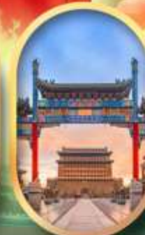
ถนนคนเดินเทียนเหมิน