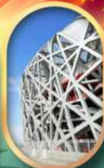
ผ่านชมสนามกีฬาโอลิมปิก