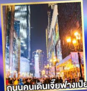
ถนนคนเดินเจียงฟางเป็ย

เดินทาง 15-17 พ.ค. 69 22-24 พ.ค. 69 29-31 พ.ค. 69