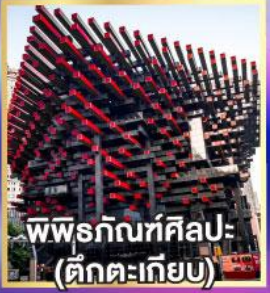
พิพิธภัณฑ์ศิลปะ (ตักตะเกียบ)