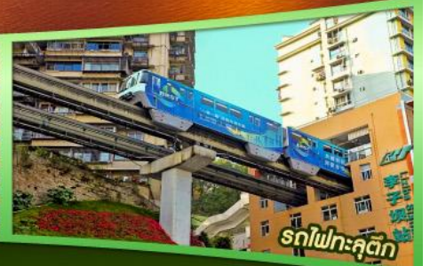
รถไฟฟ้าลัดคิว