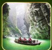
ล่องเรือแม่น้ำไตคินกูฮิว