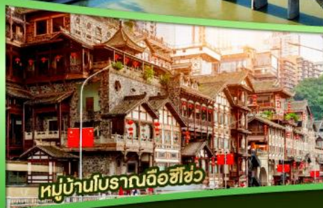
หมู่บ้านโบราณฉือฮิว

ไปเที่ยวฮิลใจ ฉงชิ่ง 5 วัน 4 คืน เฉียนเจียง อุ่หลง