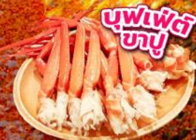
บุฟเฟ่ต์ ซาซึ

ชมใบไม้เปลี่ยนสี อุโมงค์ใบเมเปิ้ล โมบิจิโคโร