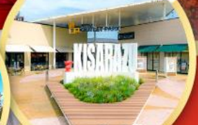
มิตซึยุ เอ้าท์เล็ต พาร์ค คิซึระซึ