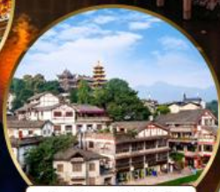
เมืองโบราณฉือจี้โฮ่ว