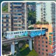
รถไฟฟ้า-อูตัก