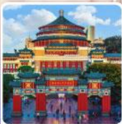
ศาลาประชาชนฉงชิ่ง