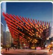
พิพิธภัณฑ์ศิลปะ-ตะเกียบ