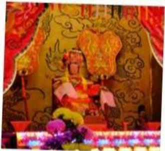
เจ้าแม่ทับทิม จอสเฮ้าส์เบย์