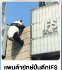
แพนด้ายักษ์ปีนตึกIFS