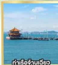
กำเรือจันทันเดียว