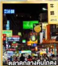
ตลาดกลางคืนโตง