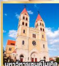
มหาวิหารเซนต์ไมเคิล