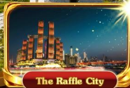
The Raffle City