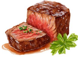
● เนื้อวัว

ขอความกรุณาแจ้งวัตถุดิบที่ท่านแพ้หรือไม่สามารถรับประทานได้