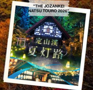
“THE JOZANKEI NATSU TOURO 2026”

วันเดินทาง 23 - 28 ต.ค. 2569 (วันปืยมหาราช) 28 ต.ค. - 2 พ.ย. 2569 30 ต.ค. - 4 พ.ย. 2569