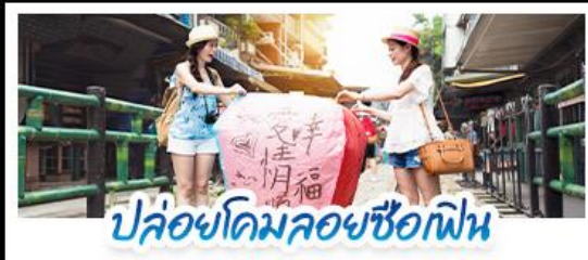
ปลั๊อคอมมอยซือเฟิน