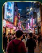
แหล่งช้อปปิ้งแฟชั่นสุดฮิต