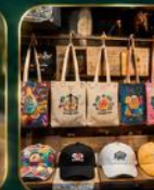
ของฝากเก๋ ๆ