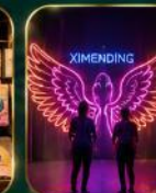
จุดเช็คอินสุดฮิต