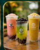
เครื่องดื่มยอดนิยม