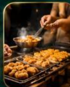
สตรีทฟู้ดชื่อดัง