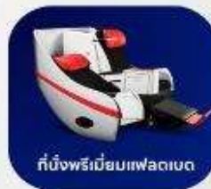
ที่นั่งพรีเมียมแพลนเน็ต