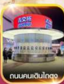
ถนนคนเดินโตง