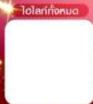
โทรฟรีทั้งหมด