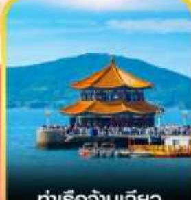
ท่าเรือจันทิยว