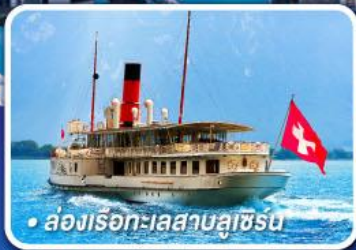
• ล่องเรือทะเลสาบลูซิร์น