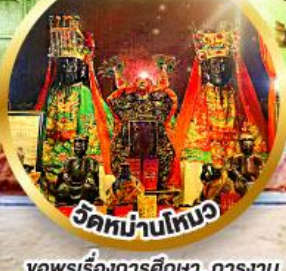
วัดท่ามใหม่ ขอพรเรื่องการศึกษา, การงาน สติปัญญาและความกล้าหาญ