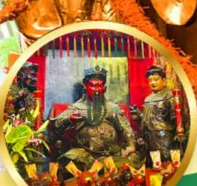
วัดกวนโก ขอพรเทพเจ้ากวนอู เงินทอง, ธุรกิจในคง