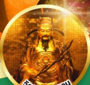
วัดหยวนหยวน ขอพรเรื่องสุขภาพ, โชคลาภ ความเจริญก้าวหน้า

เมนูพิเศษ! ต้มช้ำฮ่องกง, บุฟเฟ่ต์ชาบูสไตล์ฮ่องกง, ห่านย่าง