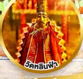
วัดลีนฟ้า ขอพรเสริมโชคลาภในธุรกิจ และการเงิน